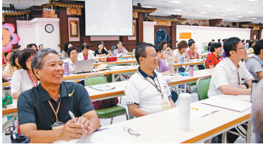
全國教師佛學營學員聽到受用處，面露法喜。