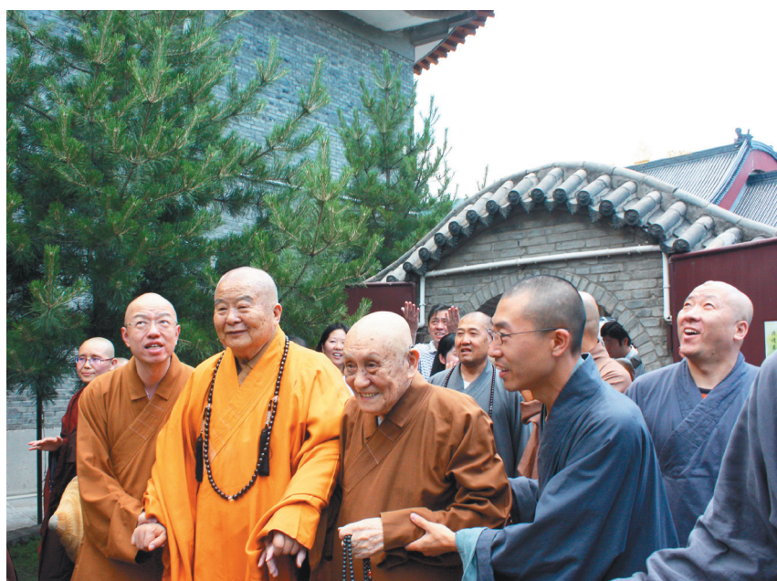
星雲大師與夢參老和尚會面，天上大降甘露雨霖，眾人抬頭一片驚呼。

「成佛不易，悟道不難。」他勉勵學生修養自我，精讀各宗論一二；體會各佛教事業、多多參學，善財童子五十三參，不排斥一法，師師有道，不要比較。大師曾參學過太虛、印光、弘一、圓瑛、正果、巨贊、通一、慈航、印順、東初、南亭、智光、證蓮、默如、戒德等法師；至少跟隨一、二小時，記住一、二句大德開示的話。最後，大師勉勵尼眾學僧發大心：人人做如瑞法師，人人做文殊菩薩。